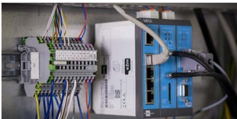
Gateway des Virtuellen Kraftwerks

Das macht die Wärme aus Strom, und somit auch aus Windenergie, heute deutlich teurer als Wärme aus dem BHKW oder anderen Wärmeerzeugern. Um Power-to-Heat aus erneuerbarem Strom auch praktisch einsatzfähig zu machen, muss sich noch einiges ändern.