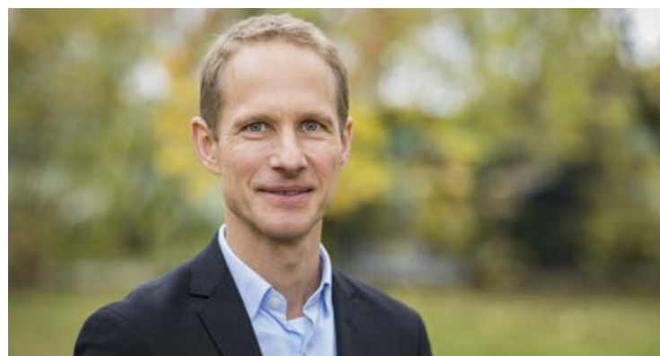
Severin Beucker © ahnenenkel.com/Silke Reents

Er zeigt auf ein weiteres Display im Keller, das die aktuelle Stromerzeugung des BHKW als gleichmäßige orangefarbene Linie anzeigt. Um diese Konstante herum flackert eine blaue Linie, die den Strombedarf der 224 Mietparteien wiedergibt. „Die Differenz zeigt die dritte Linie an, das ist der Strom, der zusätzlich aus dem Netz bezogen wird“, sagt Riedel.