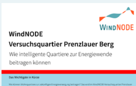
FLYER ZUM QUARTIER