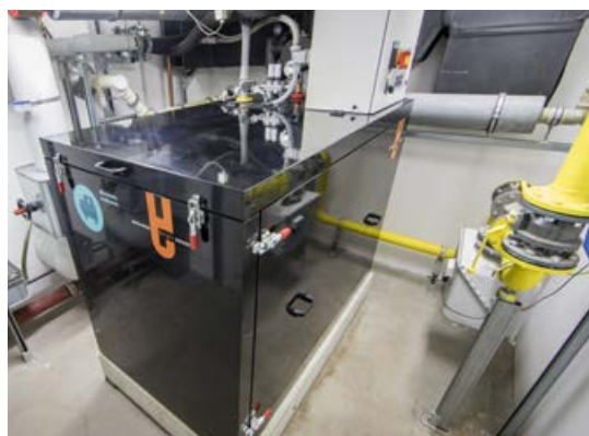
Blockheizkraftwerk im Heizkeller und Nahwärmenetz

Wenn die Mieter zur Arbeit gehen und die Kinder in der Schule sind, drosselt der digitale Wohnungsmanager, den die Firma Riedel Automatisierungstechnik entwickelt hat, den Wärmezulauf und fährt die Temperaturen runter. Rechtzeitig bevor um 17 Uhr alle wieder nach Hause kommen, beginnt er, die Wohnung aufzuheizen. Eine Besonderheit: Als selbstlernendes System legt der Wohnungsmanager autonom fest, wie viel Zeit er für das Aufwärmen der Wohnungen tatsächlich benötigt. Dabei bezieht er neben der Außentemperatur auch die Wetterprognose mit ein und weiß daher zum Beispiel, ob für den Nachmittag schlechtes Wetter und eine Kaltfront angekündigt ist.